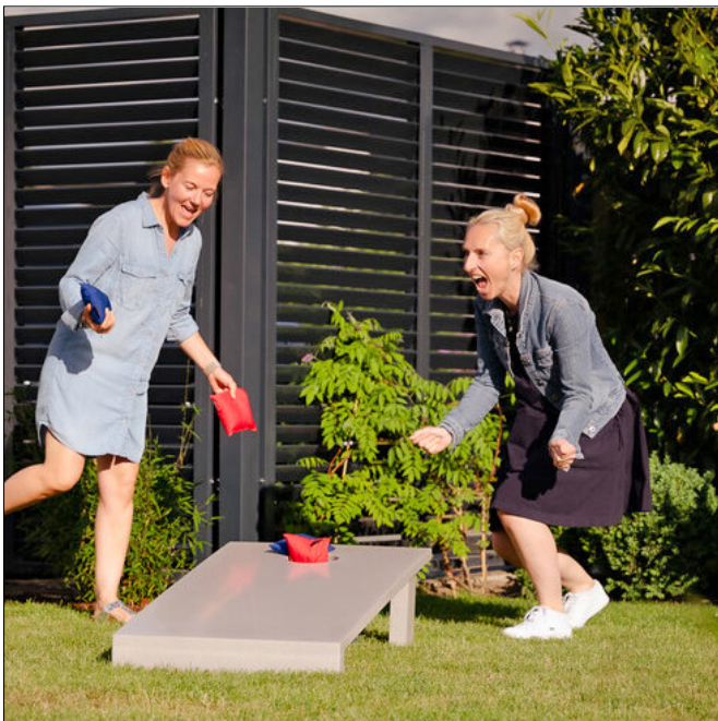
Maße: 61 x 122 cm; Gewicht: 55 kg